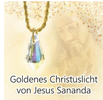
Goldenes Christuslicht von Jesus Sananda